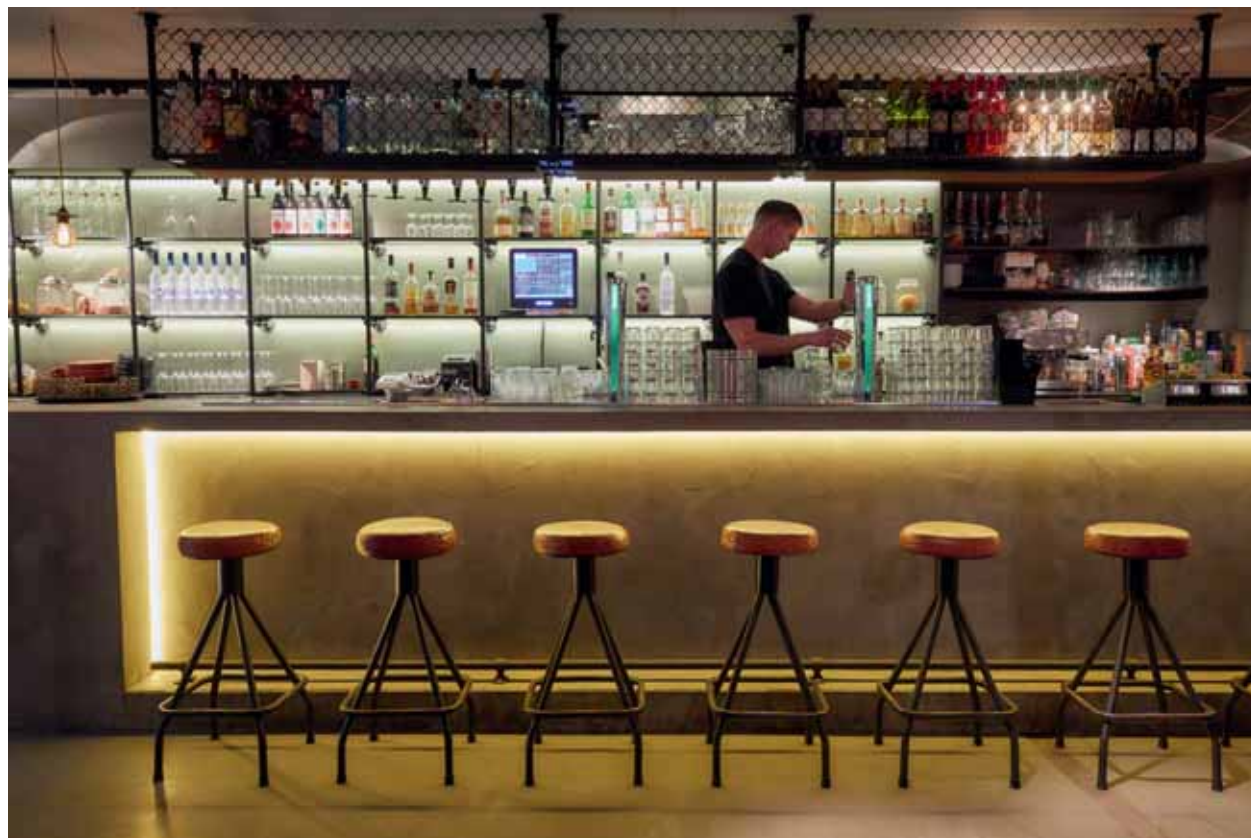
FOTO ONDER De veertien meter lange bar zorgt voor een 'urban' uitstraling die past bij de muziekprogrammering.